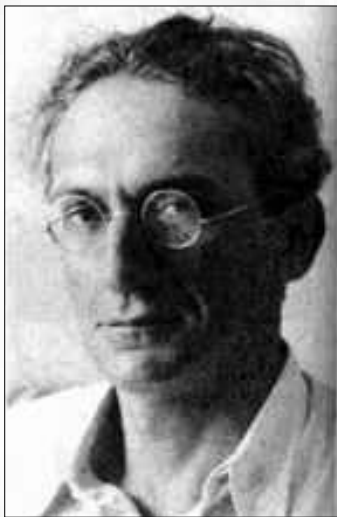
Immanuel Velikovsky hacia 1942

Immanuel Velikovsky nació en Vitebsk (Rusia) el 10 de junio de 1895 en el seno de una familia judía. Después de realizar los estudios primarios en Moscú, viaja con 17 años a Palestina, entonces una provincia turca. A su vuelta inicia sus estudios de medicina que concluye en 1921 en la Universidad de Moscú. Se especializa en psiquiatría y ejerce su profesión durante 15