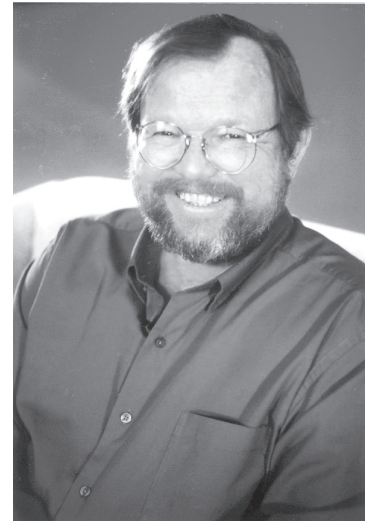
Bill Bryson