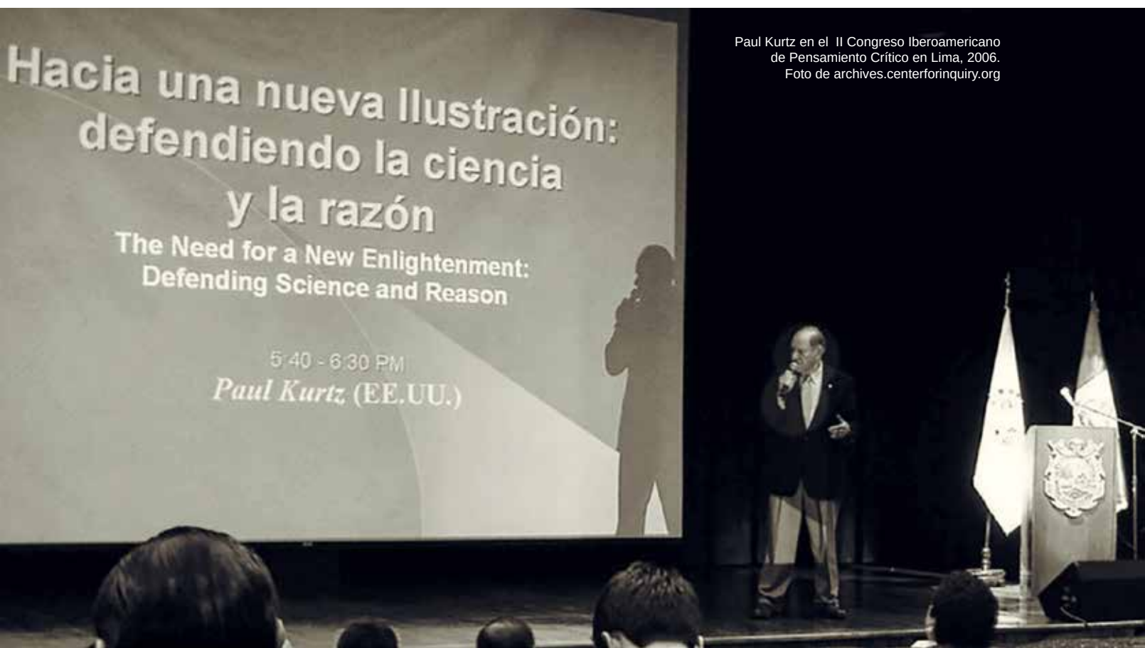
Paul Kurtz en el II Congreso Iberoamericano de Pensamiento Crítico en Lima, 2006.

Debido a nuestro interés en el escepticismo y el secularismo, se nos invitó al 13° Congreso Humanista Mundial (coorganizado por la Unión Internacional Humanista y Ética, ahora llamada Humanists International) en Ciudad de México en 1996, donde conocimos en persona a Kurtz y a otros escépticos y humanistas seculares.